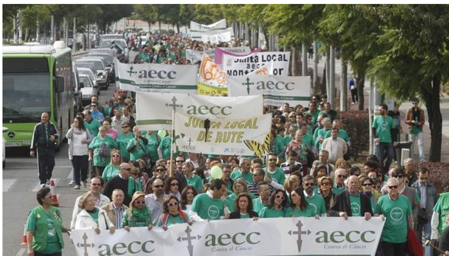
Concentración de la Asociación Española contra el Cáncer - ARCHIVO

LUIS MIRANDACórdoba - 20/12/2015 a las 18:58:24h. - Act. a las 13:34:13h.